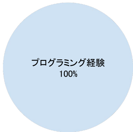
プログラミング経験